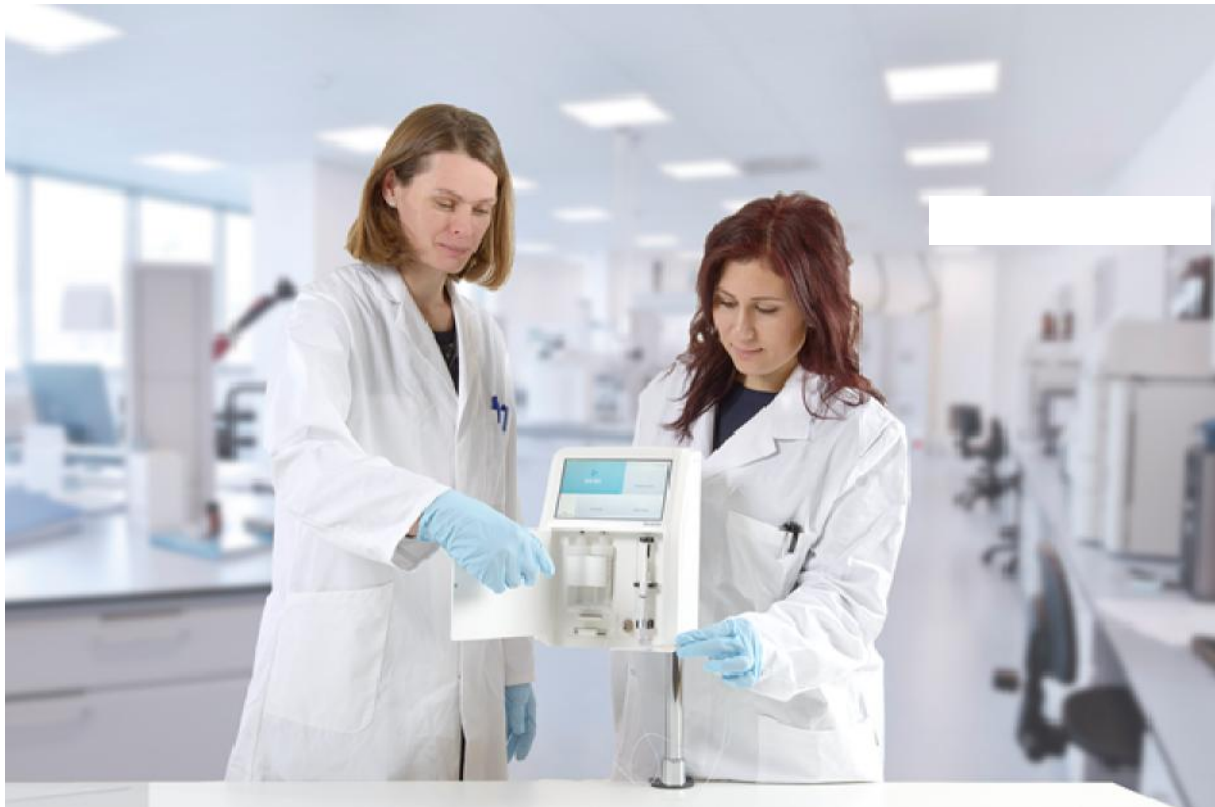
Senzime utvecklar patientnära system som möjliggör automatiserad och kontinuerlig mätning av livskritiska ämnen som glukos och laktat i blod och vävnader.