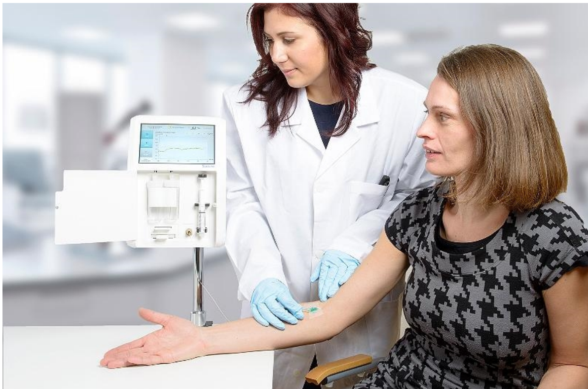
System bestående av instrument med biosensor; blod/plasma dras från patient via kateter